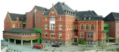
Evangelisches Krankenhaus Bethanien, Iserlohn